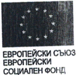
Схема за предоставяне на безвъзмездна помощ BG05M9OP001-2.004

„Услуги за ранно детско развитие“ Проект № BG05M9OP001-2.004-0042 „Комплекс за социално-здравни услуги за деца и семейства“